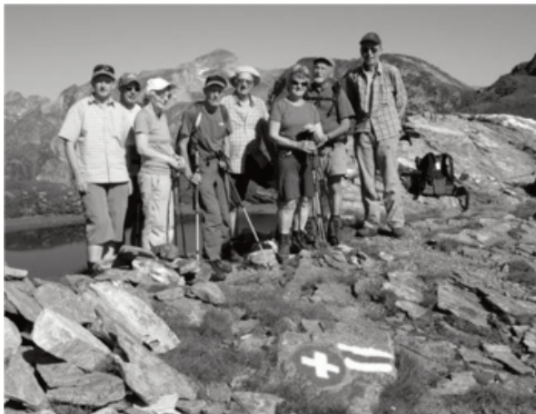
(suite des rapports reçus dans un prochain Bulletin et sur le site)

On se retrouve au restoroute à Erstfeld, certains ont passé par le col. On se quitte après ces trois belles journées au Tessin.