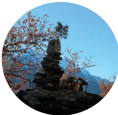
Un cairn rencontré au détour d'un sentier valaisan.